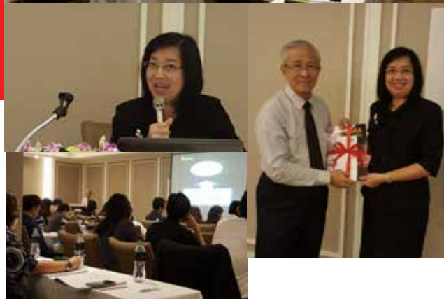
Training on Customs Act B.E. 2560 on Tuesday, 27th June 2017 at the Narai Hotel.