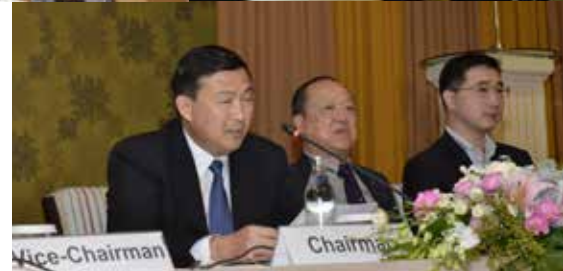
50th AGM on 25th July 2017 at Dusit Thani Bangkok Hotel