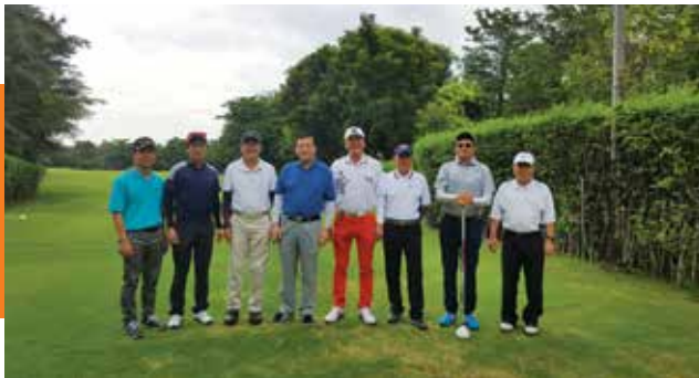
Golf tournament between BSAA/TNSC at Krungthep Kreetha Golf Course and dinner at Nuvola.