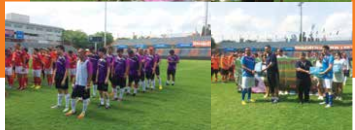
Joined seven parties, namely PAT, Customs Dept., TNSC, BSAA, TIFFA, CTAT and IMP-EXP Transport Association for the Friendship football tournament at PAT Stadium.