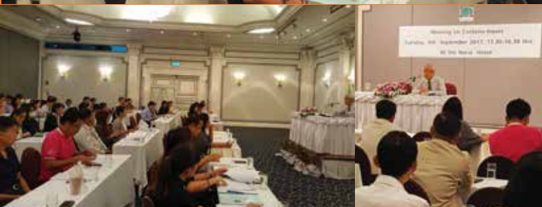
Meeting on Customs Act at Narai Bangkok