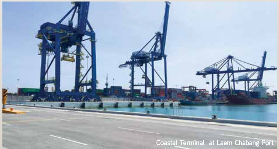
Coastal Terminal at Laem Chabang Port

The company offers a warehouse and yard management for automotive businesses in preparation prior to their export and import. The company also provides pre-delivery inspection, contamination inspection and transportation. Apart from automotive yard management, the company offers on-site