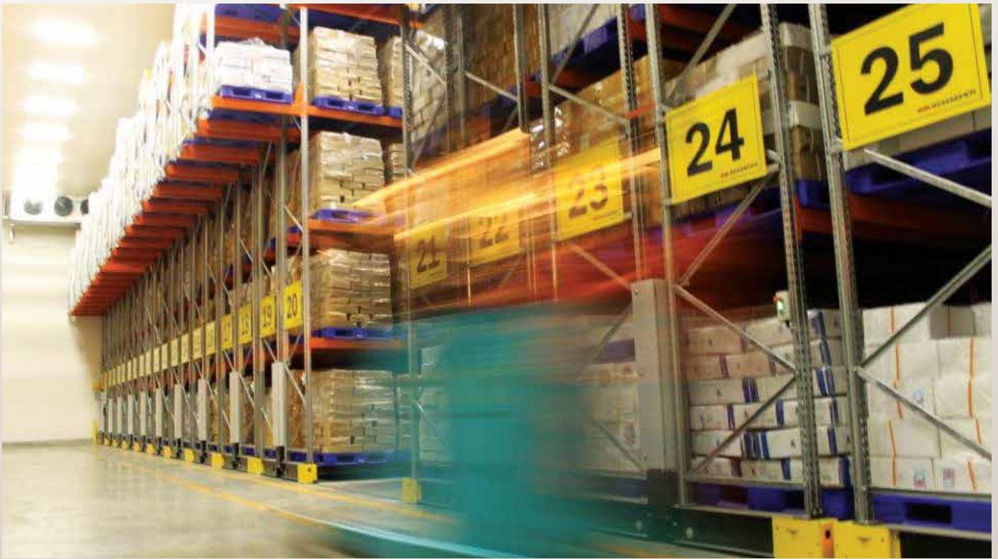
JWD's cold storage facility