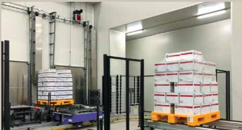
JWD's cold storage facility

The company is experienced in dangerous goods management under the strict guidelines of Laem Chabang Port for more than 16 years. JWD has been handling 170,000 containers per year. The company is fully equipped with experienced personnel, advanced software systems, and related equipment. It has more than 150 tractors at Laem Chabang Port. The company is confident that it can be immediately functional when the terminal is opened officially for operation. According to the latest task of containers lifting, JWD is preparing 66 manpower, while PAT will supply the heavy equipments. All in all, the company is determined to support PAT policy to achieve the goal of becoming an integrated marine hub in the region. ■