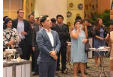
BSAA held "Members Get Together Cocktail Party"