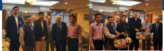
BSAA host Friendship Golf Tournament with Port Authority of Thailand (PAT) on Wednesday, 22 November 2017 at The Lake Wood Country Club, Bangplee, Samutprakarn. The winner of this year tournament is PAT.